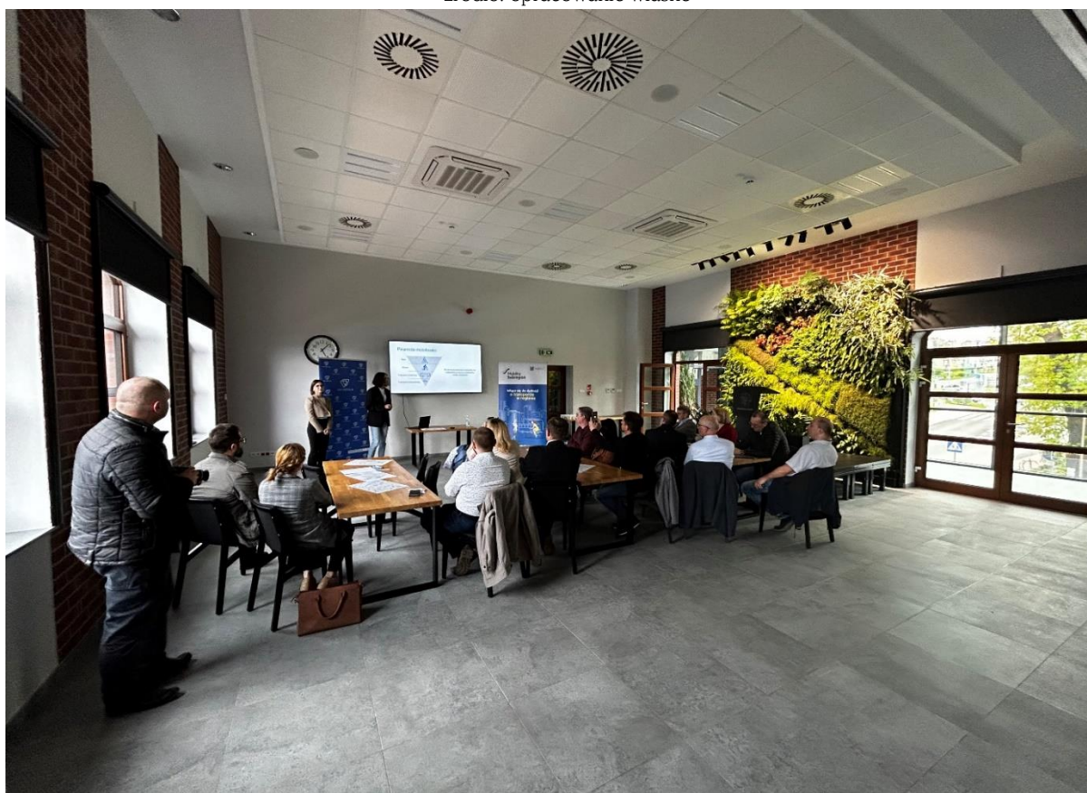
Fotografia 2.2 Spotkanie dla mieszkańców powiatu wodzisławskiego