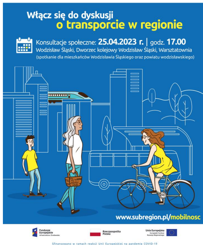
Rysunek 1.3 Przykładowy plakat zapraszający do udziału w spotkaniu