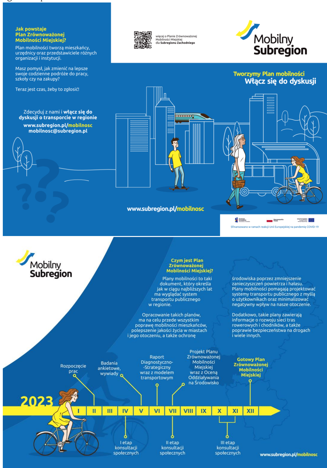
Rysunek 1.4 Awers i rewers ulotek dystrybuowanych w ramach Fazy 1. Konsultacji

W ramach konsultacji dystrybuowane były także ulotki, których podstawowym celem było zapoznanie odbiorców z celami i korzyściami wynikającymi z opracowania dokumentu, a także przewidywanym harmonogramem prac.