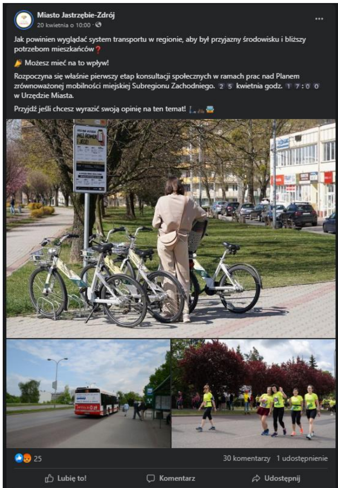
Rysunek 1.2 Post na portalu Facebook UM Jastrzębia-Zdroju zapraszający do udziału w spotkaniu