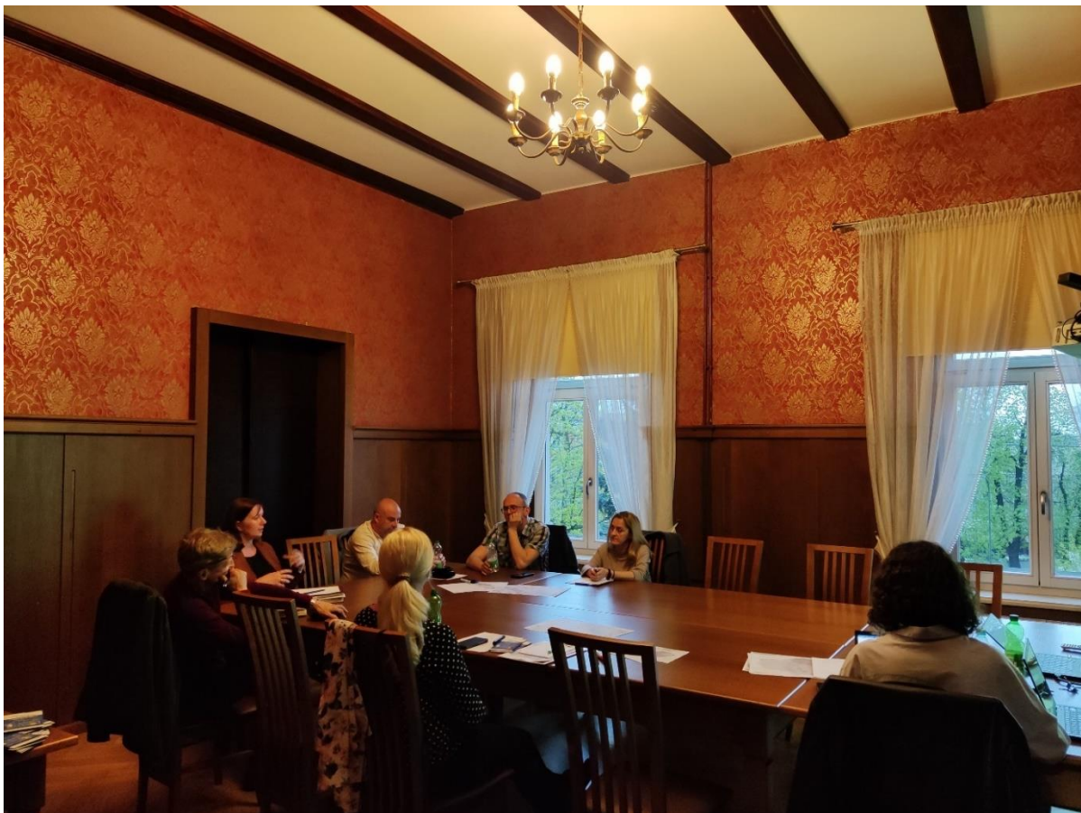
Fotografia 2.3 Spotkanie dla mieszkańców powiatu rybnickiego