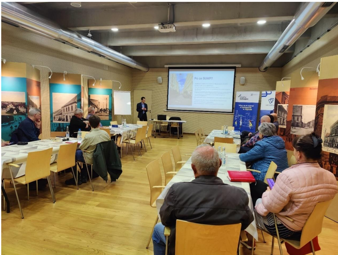
Fotografia 2.5 Spotkanie dla mieszkańców Żor