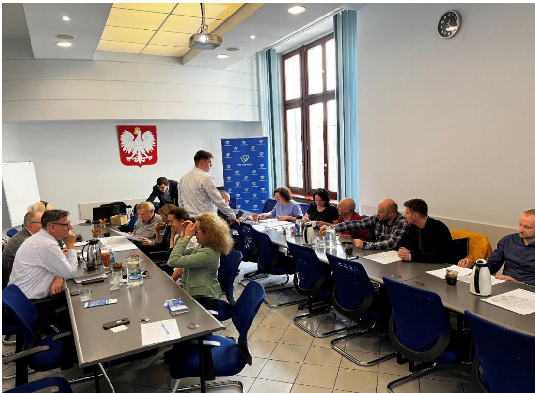
Fotografia 2.6 Spotkanie dla mieszkańców powiatu raciborskiego