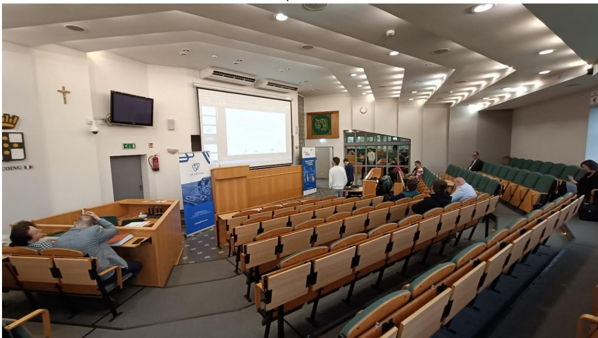
Fotografia 2.4 Spotkanie dla mieszkańców Jastrzębia-Zdroju