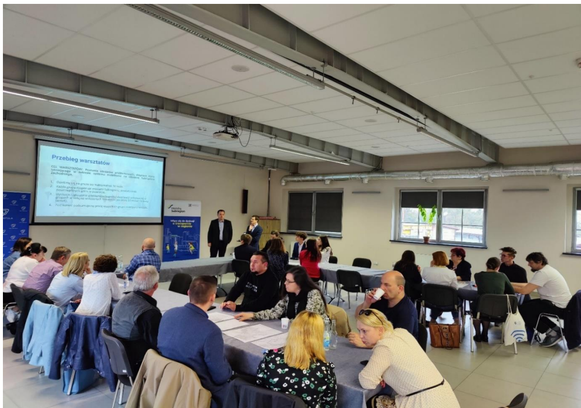
Fotografia 2.1 Spotkanie dla mieszkańców Rybnika